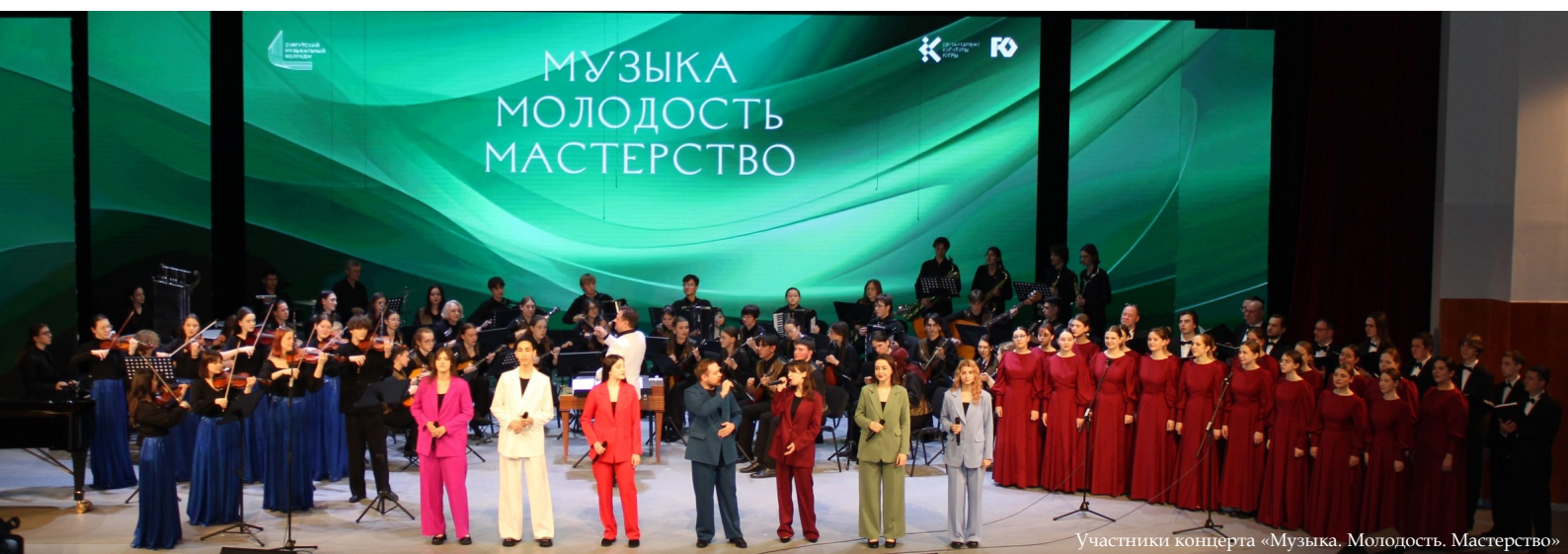
Участники концерта «Музыка. Молодость. Мастерство»