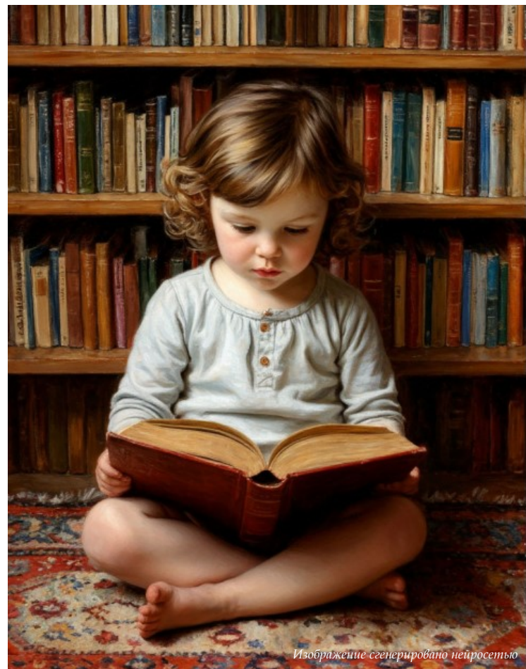
Изображение сгенерировано нейросетью

Что ж, список более чем внушительный, но кое-кого в