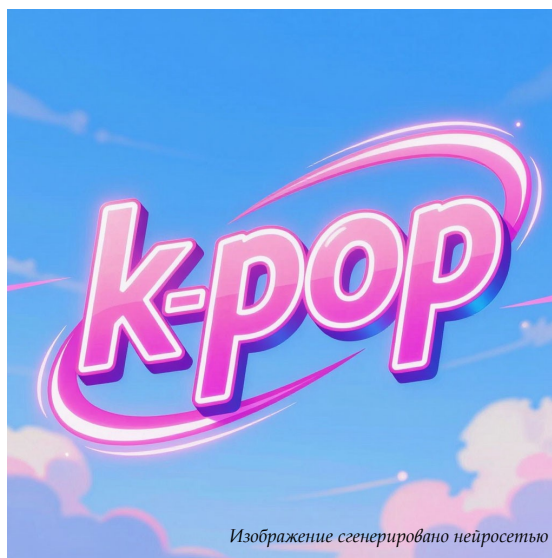
Изображение сгенерировано нейросетью